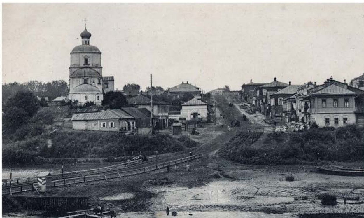
11. Церковь Георгиевская (фотография до 1917 года)