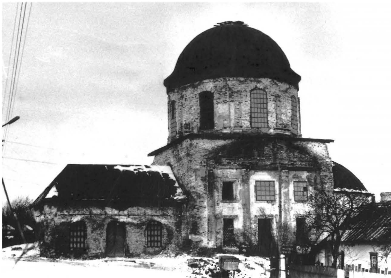
Фотография Андрея Агафонова, 1991 год 12. Фреска «Нагорная проповедь» начала 19 века. Фотография 2007 года